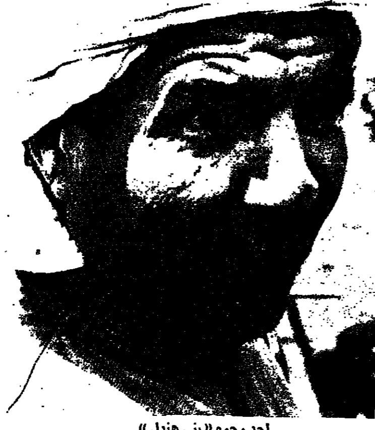
أحد وجوه «بني هنغل»

بعد السينما المصرية ، تأتي السينما الجزائرية من حيث النشاط والانتاج ، خصوصا وانها ولدت وسط معارك التحرير ، فأخرجت أفلاما عدة من قياسي 16 ملم ، منها فيلم «الجزائريون» ، وفيلم «الاسمينة» ، وفيلم «صوت الشعب» . ونحن استقلت الجزائر واهتمت دور العرض ، أصبح القطاع العام هو المسؤول عن السينما ، فانتجت عدة أفلام جيدة منها : «سنوات الحب» الذي نال جائزة مهرجان كان لعام 1975 ، وفيلم «معركة الجزائر» ، وفيلم «الزواجر» انتاج جزائري - فرنسي مشترك . وفي الجزائر الآن 400 دار للعرض ، قام بتأسيسها المركز القومي للسينما الجزائرية . أما أول فيلم طويل انتج بعد الاستقلال